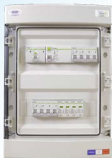
Coffret AC pour application photovoltaïque