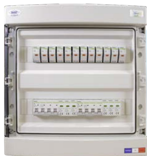
Coffret DC pour application photovoltaïque