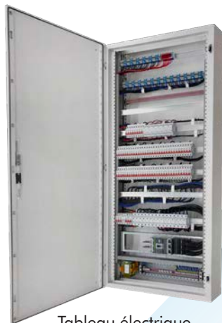
Tableau électrique pour le tertiaire