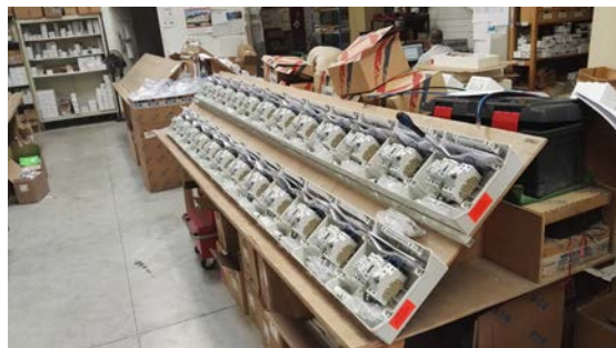
Exemples de fabrication dans notre atelier.

Avec nos fabrications de coffrets nous avons fourni plus de 200MWc d'installations PV en moins de 7 ans, soit 4% du parc France (dont 15% des installations PV < 3kWc).