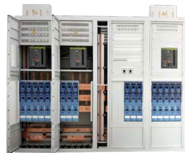
TGBT AC 400 ou 800V jusqu'à plus de 2500A