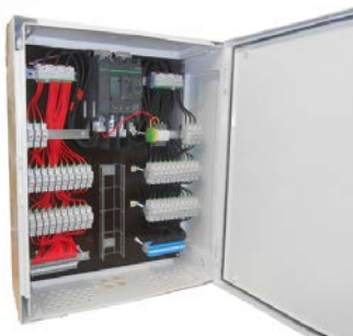
Boîte de jonction multi strings