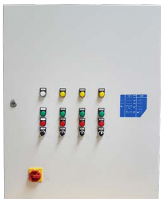
Coffret pour application de pompage