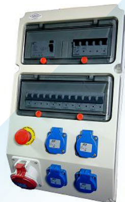
Coffrets de chantier