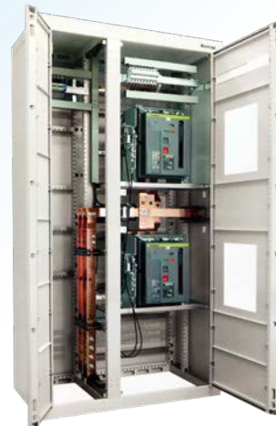
TGBT de forte puissance